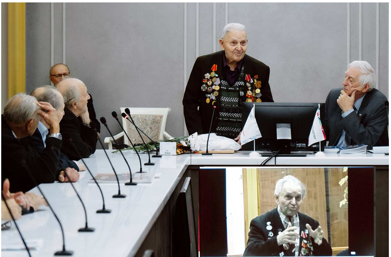
В заключение выступил именинник...