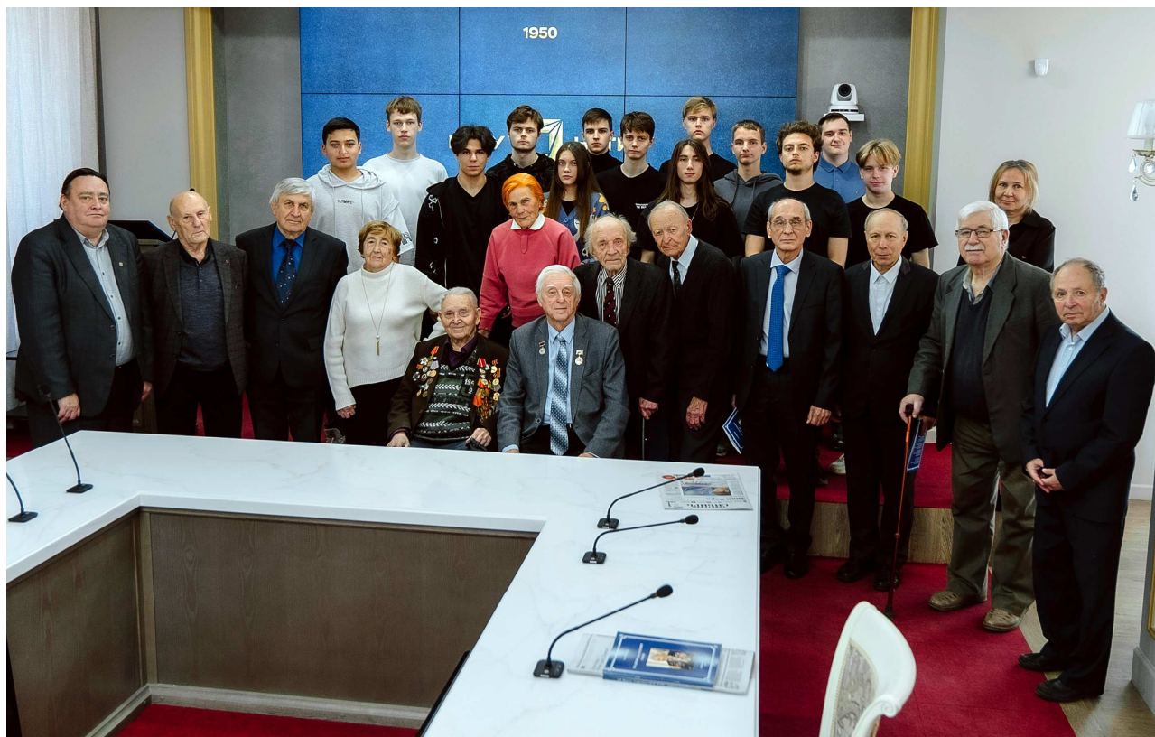
Участники встречи (в неполном составе)