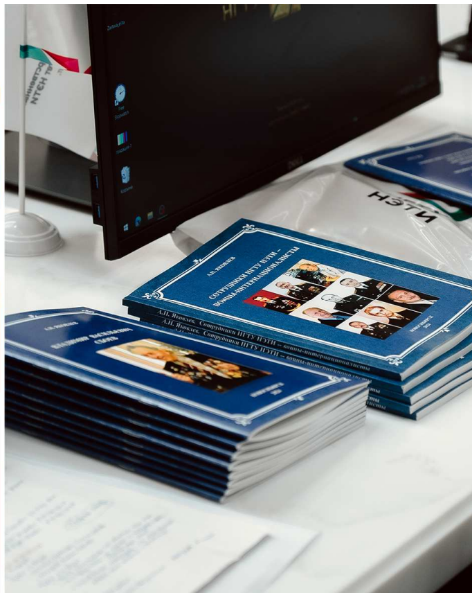
Книги, которые автор (А.Н. Яковлев) дарил выступающим...