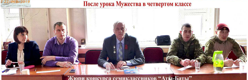
Жюри конкурса семиклассников "Аты-Баты"