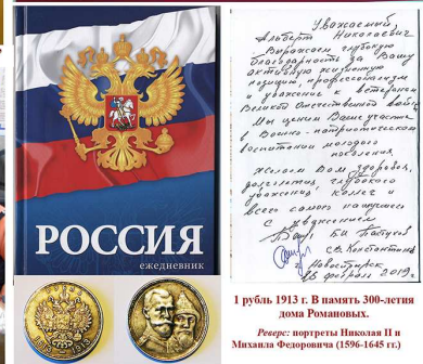
1 рубль. 1913 г. В память 300-летия дома Романовых. Резер: портреты Николая II и Михаила Фёдоровича (1896-1645 гг.)