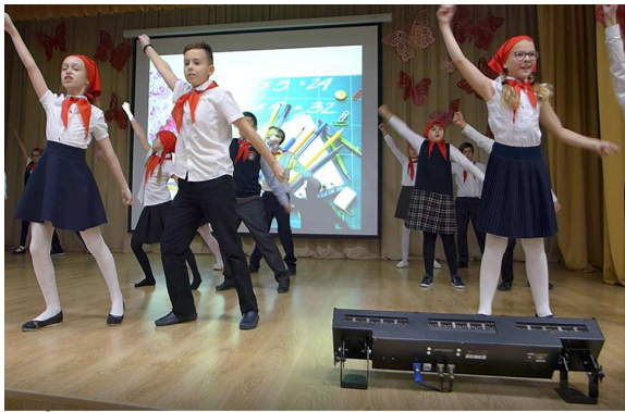
Встречу открыло выступление пионеров школы. В школе с недавнего времени возрождена пионерская организация!