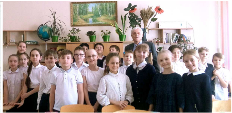
После урока Мужества в четвертом классе