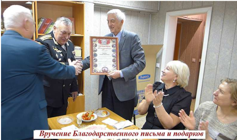
Вручение Благодарственного письма и подарков