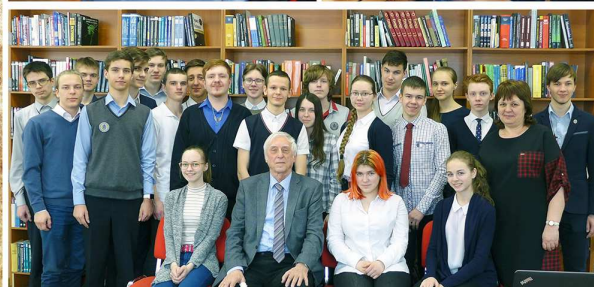
22 марта 2018 г. Беседа проф. А.Н. Яковлева с учащимися Инженерного лицея НГТУ