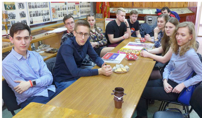
Студенты слушают воспоминания блокадниц...