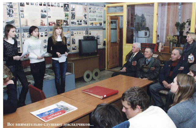
Все внимательно слушают докладчиков...