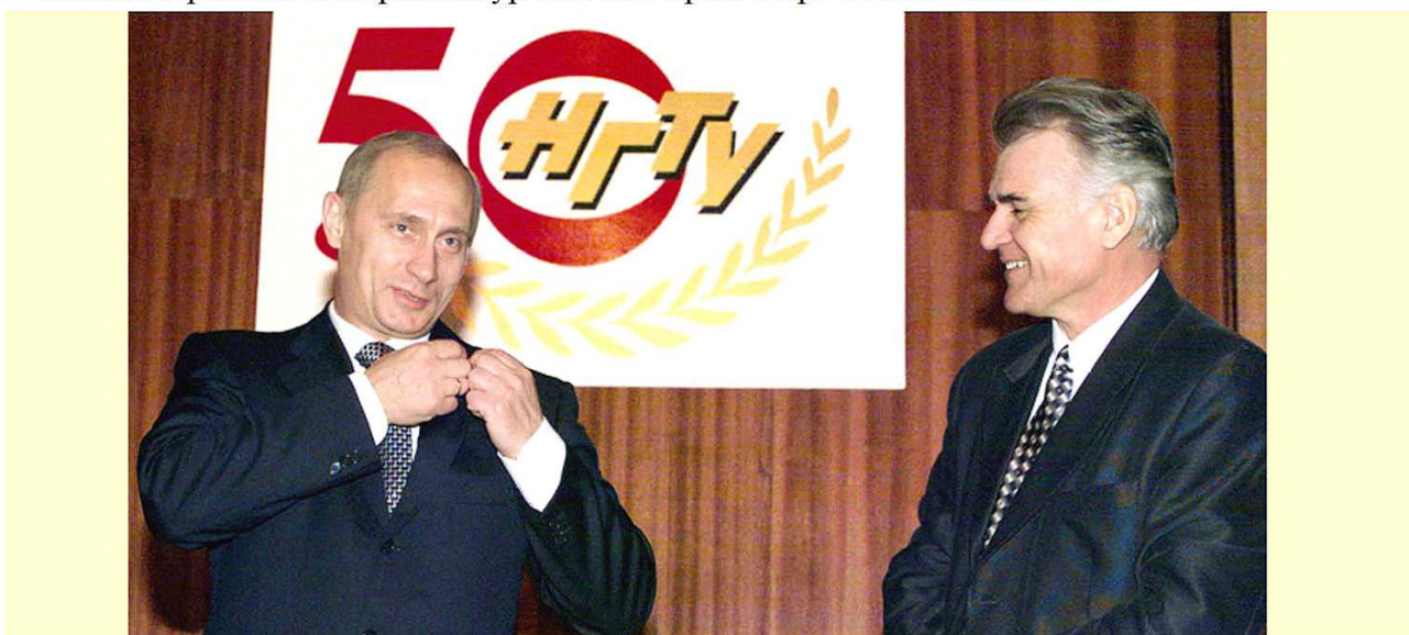
16.11.00 г. Владимир Владимирович прикалывает к пиджаку Юбилейный (золотой) значок НГТУ, врученный ему ректором А.С. Востриковым

Во время Юбилейной недели (13-18 ноября) особо следует отметить визит Президента Владимира Владимировича Путина в НГТУ (16 ноября). На встрече в конференц-зале с сотрудниками и студентами Президент вручил Благодарственное письмо и сообщил, что вузу в ближайшее время будет поставлен высокопроизводительный компьютер новейшей архитектуры на базе процессора ULTRASPARC-III.