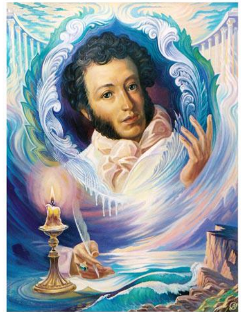
«Российского Престопа Пленник» — Художник В. Суворов

Читальный зал редкой и ценной книги приглашает познакомиться с миниатюрными изданиями произведений поэта, с уникальным Пушкинским календарем-справочником, стильным, роскошным изданием Пушкинской энциклопедии (1907-1915 гг.), Онегинской энциклопедией и альбомом «Пушкин в русской и советской иллюстрации». В Пушкинском календаре впервые в истории пушкинистики предпринята