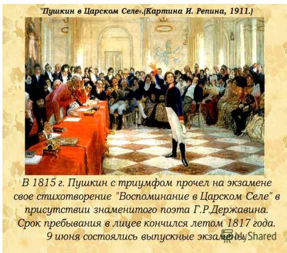
Пушкин в Царском Селе. (Картина И. Репина, 1911.)

В 1815 г. Пушкин с триумфом прочел на экзамене свое стихотворение "Воспоминание в Царском Селе" в присутствии знаменитого поэта Г.Р.Державина. Срок пребывания в лицее кончился летом 1817 года. 9 июня состоялись выпускные экзамены.